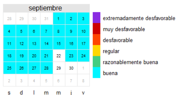
SO 2 Septiembre 2021