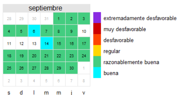
O 3 Septiembre 2021